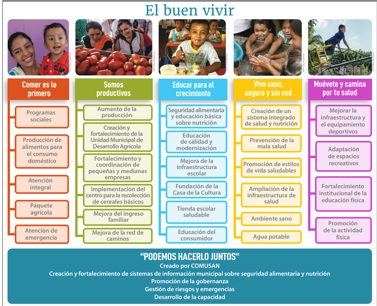
Figura 2 Plan de acción municipal para Las Vueltas, Chalatenango

La creación de plataformas locales multisectoriales y de múltiples interesados para la seguridad alimentaria y la nutrición con miras a una ejecución eficiente, junto con la generación de datos sobre nutrición, los sistemas de monitoreo y el empoderamiento y la sensibilización de la comunidad siguen siendo una inversión a largo plazo para el país y las comunidades necesitadas que se enfrentan a múltiples formas de malnutrición en El Salvador.