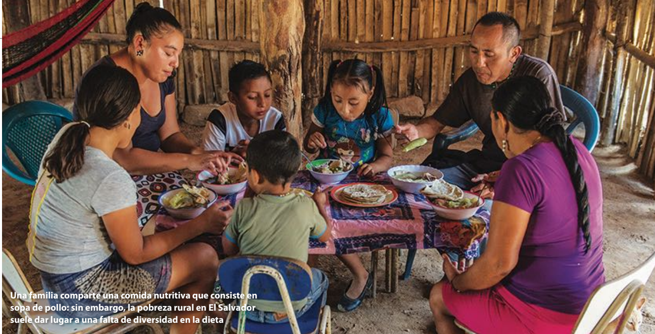
Una familia comparte una comida nutritiva que consiste en sopa de pollo; sin embargo, la pobreza rural en El Salvador suele dar lugar a una falta de diversidad en la dieta