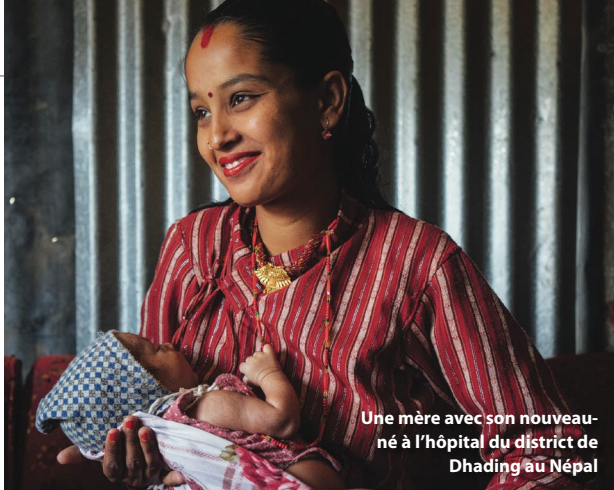
Une mère avec son nouveau-né à l'hôpital du district de Dhading au Népal